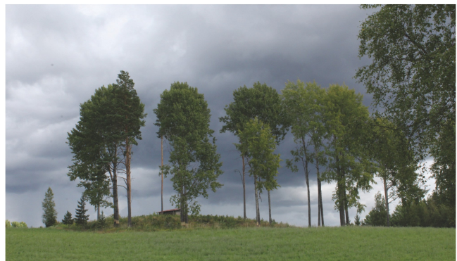
By Katja Mattsson

Sprachen als Schlüsselkompetenz Neben einem Vollzeitstudium können die drei großen Sprachen auch als Schlüsselkompetenzmodule belegt werden. Die Kurse beginnen regelmäßig im Wintersemester. Auch weiterführende Sprachkurse können besucht werden.