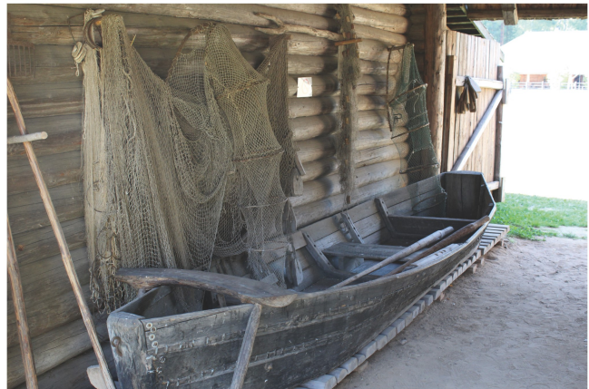
By Katja Mattsson

Neben einer gründlichen Ausbildung in finnougristischer Sprachwissenschaft spielt vor allem der Spracherwerb eine Rolle: Die Studierenden lernen ihre Erstsprache nach Wahl ab dem 1. Semester, die Zweitsprache ab dem 5. Semester. Außerdem beinhaltet das Studium den Erwerb von landeskundlichen, kulturhistorischen und folkloristischen Kenntnissen.