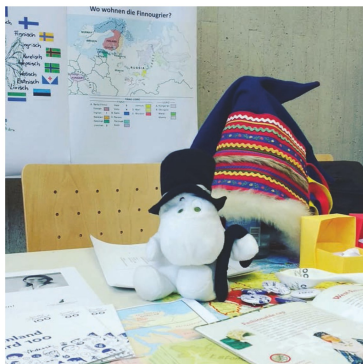
By Katja Mattsson

Den Mittelpunkt des Studiums der Finnisch-Ugrischen Philologie bilden Sprachwissenschaft und Spracherwerb. Das Finnisch-Ugrische Seminar der Georg-August-Universität Göttingen kann dank eigener Lektorate für Estnisch, Finnisch und Ungarisch jede dieser drei großen Sprachen gleichermaßen intensiv zum Unterricht anbieten.